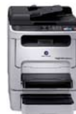
magicolor 1690MF-dt С дуплексом и нижним лотком подачи