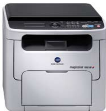
magicolor 1680MF Стандартная конфигурация