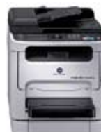
magicolor 1690MF-d С дуплексом и подставкой