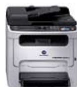
magicolor 1690MF Стандартная конфигурация