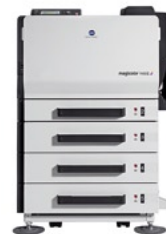
magicolor 7450II GA с дуплексом, 3 нижними лотками и установочным основанием