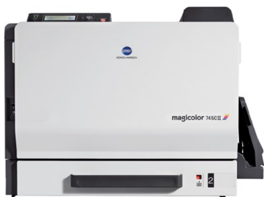
magicolor 7450II GA

Вам, как профессионалу в области полиграфии и графики, очень важно добиваться превосходного качества и цветопередачи! Если вы работаете художником, дизайнером, в рекламном агентстве или дизайн-студии, вы серьезно относитесь к качеству цветной печати, поскольку постоянно используете цвет в своей деятельности. magicolor 7450II GA от Konica Minolta — это цветной высокопроизводительный принтер формата A3+, созданный специально для работы в творческих коллективах.