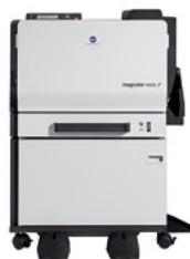
magicolor 7450II GA с дуплексом и установочной тумбой